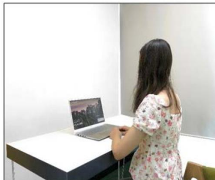
图3：侧后方第二机位效果图